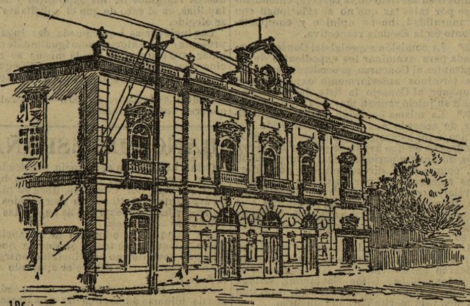
Teatro Rosalia Castro, de Vigo, vendido por sus propietarios a una importante casa de comercio, que lo dedicará a grandes almacenes

— Coruña 26. Una vez más se ha puesto de relieve la falta de condiciones de seguridad de esta Cárcel y la escasez de personal, habiendo en ella penados de tanto cuidado como los que se han fugado en ésta, que seguramente no será última tentativa. Ayer de madrugada tuvo lugar la evasión, que ocurrió del modo siguiente: En el departamento llamado «Cadenas» había 17 presos, todos condenados a grandes