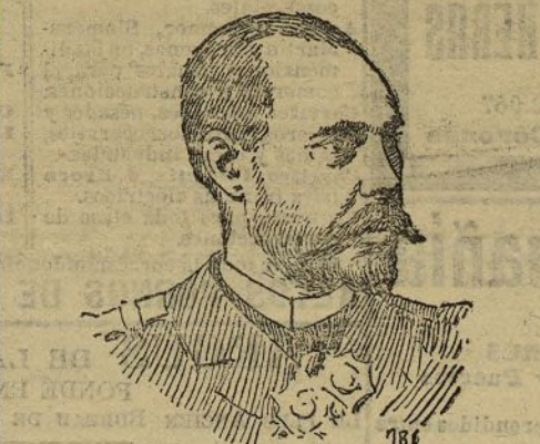
El comandante del buque ruso Jenise muerto heroicamente en la bahía de Dalm, colocando torpedos.