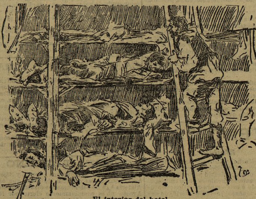
El interior del hotel

Entre la balumba de sucesos que publican los periódicos ha corrido estos días, como canto de arroyo, la noticia de haber muerto de hambre y frío un desgraciado. No es el primero de este invierno, si Dios no lo remedia: los hombres no impedirán que sea el último.