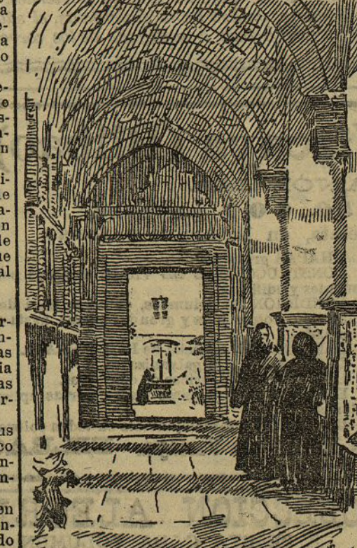
Claustro del convento de Regla

En él están recogidos 14 niños reparando sus organismos enclenques y violados, arrojando de su cuerpo la miseria orgánica y ates-