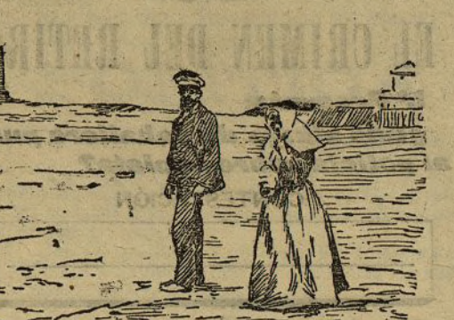
La playa del Sanatorio

Estas cantidades, unidas a otros pequeños donativos de generosas almas, sirvieron para