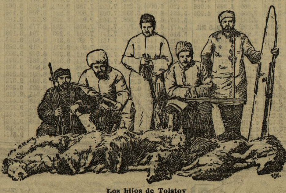
Los hijos de Tolstoy