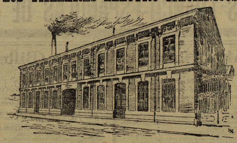
Vista general de la fábrica

En diversas ocasiones se ha disutado si la capital de España era inferior en movimiento industrial a otras poblaciones de la Península, y mientras los defensores de Madrid sostenían que podía muy bien competir con el de otras capitales tan importantes como Barcelona, sus detractores, inspirados por un prejuicio ó por un sentimiento regionalista, argumentaban que no os más que una población burocrática, de gran comercio, en donde, en punto a producción, solamente predominaba la pequeña industria, que ha logrado adquirir gran desarrollo.