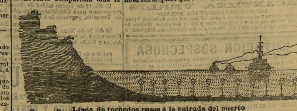
Línea de torpedos rusos á la entrada del puerto

«El almirante ordenó á la gente. A las nueve de la mañana del martes tomamos nuevo rumbo á Puerto Arturo, y la segunda división de la flotilla de torpederos iba escondida y protegida por los buques. Los que habíamos tomado parte en el primer