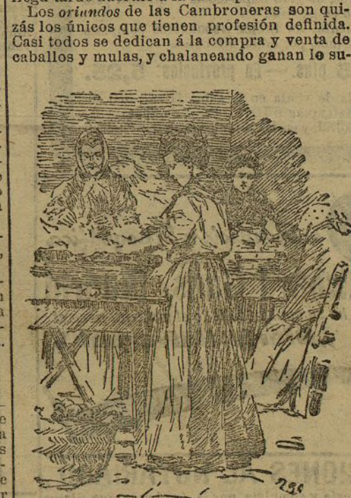
Peladoras de tomate

Los oriundos de las Cambronerías son quizás los únicos que tienen profesión definida. Casi todos se dedican a la compra y venta de caballos y mulas, y chalanando ganan lo su-