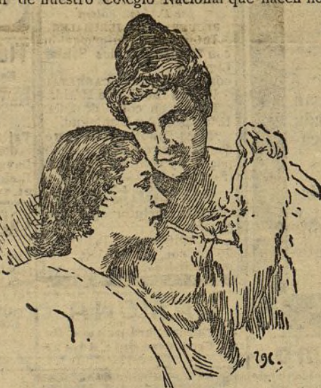
Miss Elena Keller y Miss Sullivan

Los progresos que se realizan en la enseñanza de sordo-mudos y ciegos son verdaderamente maravillosos; cien ejemplos notables podría citar de nuestro Colegio Nacional que hacen ho-