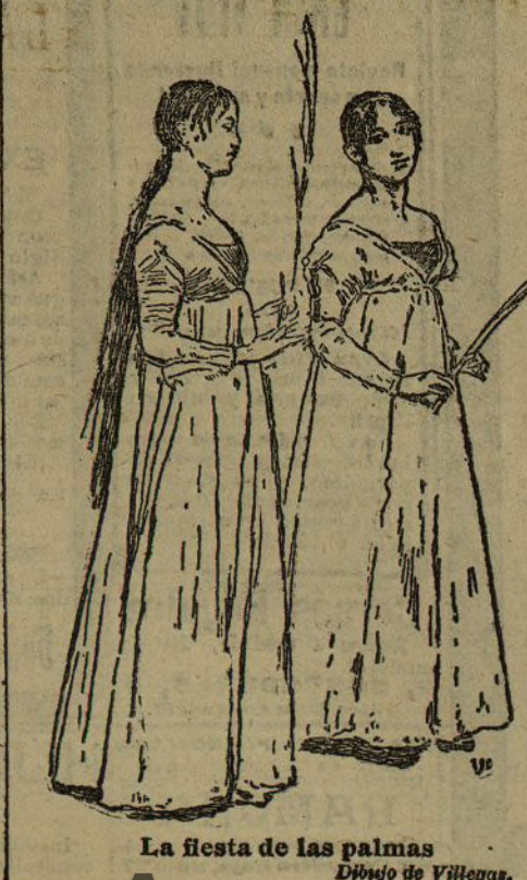
La fiesta de las palmas. Dibujo de Villagras.