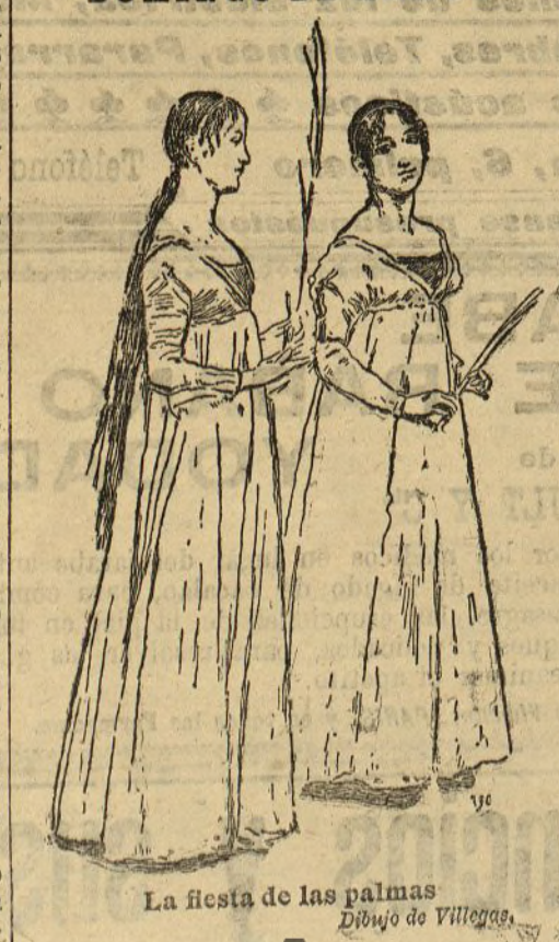
La fiesta de las palmas. Dibujo de Villages.