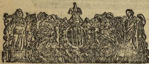
Blasón de Cataluña

SERVICIO TELEGRÁFICO Y TELEFÓNICO DEL DIARIO UNIVERSAL