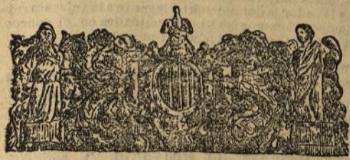
Blasón de Cataluña

SERVICIO TELEGRÁFICO Y TELEFÓNICO DEL DIARIO UNIVERSAL