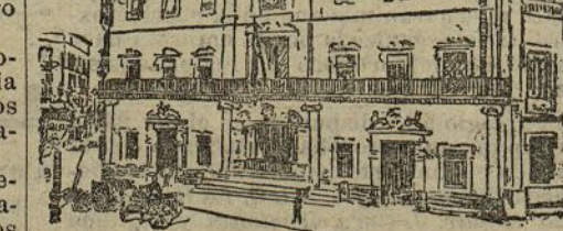
Palma de Mallorca.—Casas Consistoriales

al rey, entre ellas las del Ayuntamiento y la Diputación.