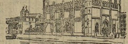
Palma de Mallorca.—La Lonja

rigido al gobernador el delegado del Gobierno en Ciudadela, el recibimiento que allí se hizo al rey fué en extremo cariñoso.