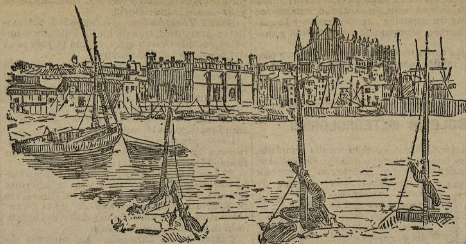
Palma de Mallorca.—Vista general