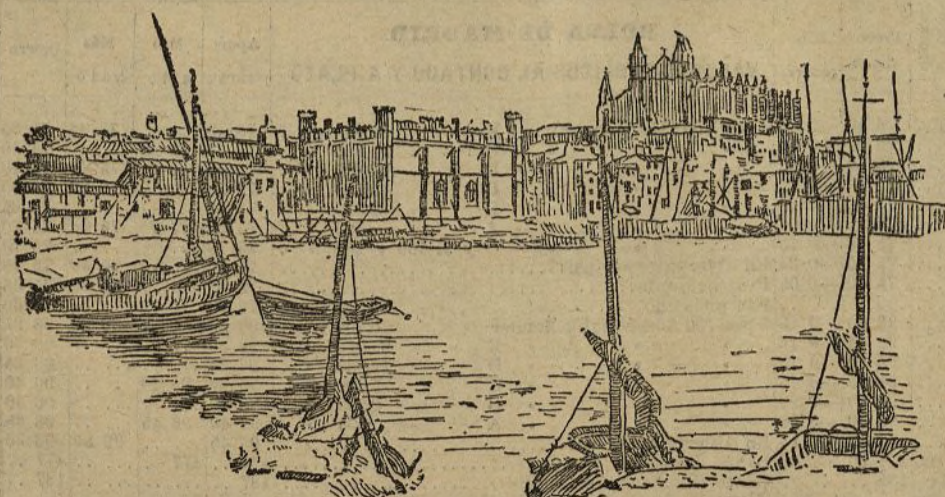
Palma de Mallorca.—Vista general