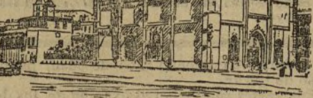
Palma de Mallorca.—La Lonja

Las campanas anunciaron entonces la próxima llegada del rey, y en un momen-