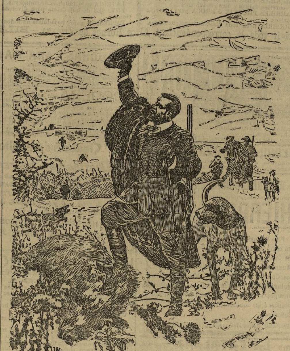
Retrato del duque de Dénia

Yo veo en el ilustre director de nuestra Escuela de Bellas Artes una de las figuras del arte pictórico contemporáneo más dignas de estudio. Para ello me atrevo, tanto a la serie respetable de obras que constituyen el núcleo importante de su vasta producción, sino más bien al procedimiento seguido por el maestro al ejecutarlas; a su manera progresiva, a su esencia creadora.