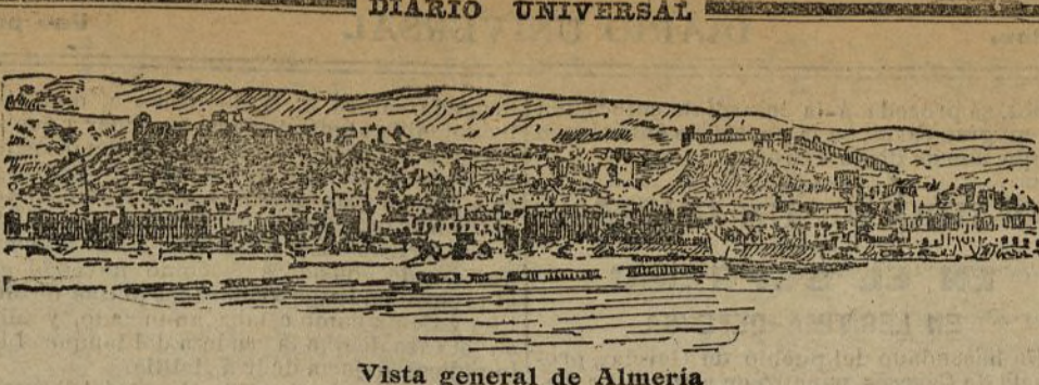
Vista general de Almería

¿Remedio a esta enfermedad? Primeramente un buen cultivo, una excelente preparación del suelo, empleo de abonos