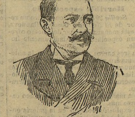
D. José Contreras Gobernador civil de Granada

Granada 30. A las cinco de la tarde se dirigió el monarca a la Fábrica de pólvora del Fargue, acompañado de los