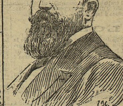
Dr. Amor y Rico Alcalde de Granada

Por estar cansado del ajeteo del viaje no asistió anoche a la función regia que