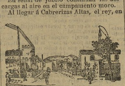
CEUTA.—Puente de la Almira

En señal de júbilo continúan las descargas al aire en el campamento moro. Al llegar a Cabrerizas Altas, el rey, en