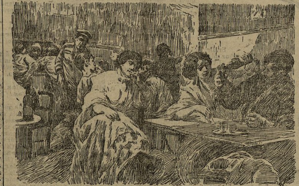
UN CAFETÍN DEL MUELLE, cuadro de Carlos Verger

Carlos Verger es uno de los pintores jóvenes que vienen con más arrestos a la lucha artística.