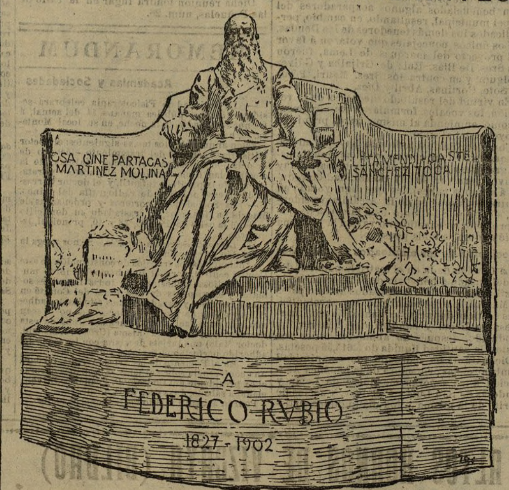
Fragmento del monumento a D. Federico Rubio, por Miguel Blay

Reproducidas ya por nosotros algunas de las obras que presenta a este Certamen el maestro Muñoz Degraín, ofrecemos hoy a nuestros lectores un dibujo del monumento a D. Federico Rubio, del exquisito artista Gonzalo Bilbao.