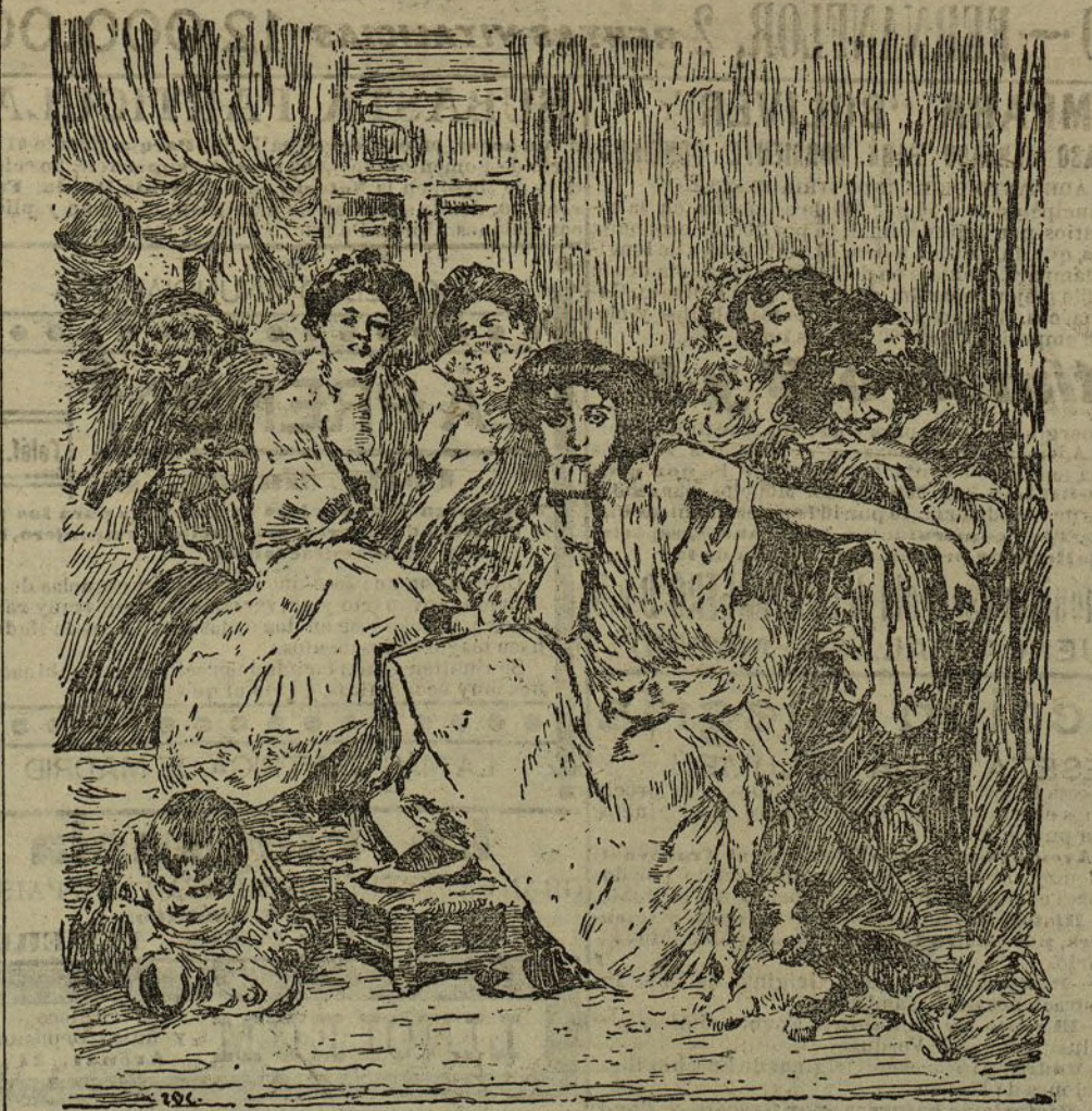
LA ESCLAVA, cuadro de Gonzalo Bilbao