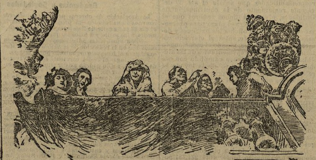
Fragmento del techo pintado por Juan Comba en el palacio de la Infanta Isabel, cuya reproducción figura en la sección de Arte decorativo

El nombre de Comba, de quien hoy reproducimos las dos obras que lleva a la Sección de Arte decorativo de esta Exposición, va unido con timbres de prestigio a la historia de la Prensa ilustrada de España.