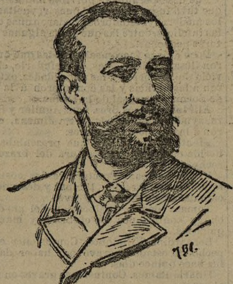
El príncipe de Mónaco

Añade que el príncipe a que alude pretende desde hace tiempo visitar a su padre el rey de Italia, no pudiendo hacerlo por la prohibición del Vaticano, y