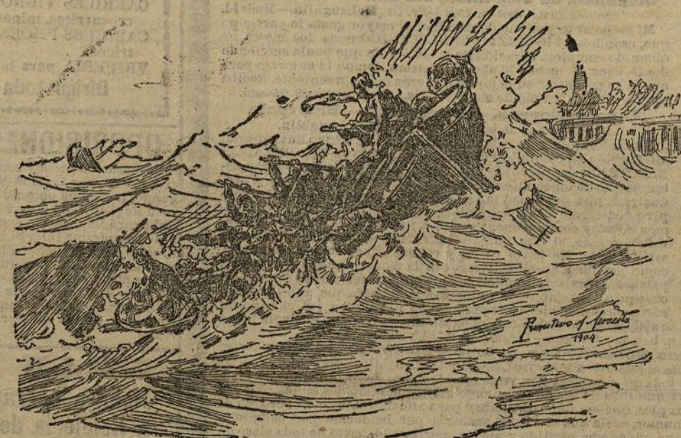
En el Cantábrico, cuadro de D. Primitivo A. Armentis

su totalidad por la flojera, quedan exentas de contribución proporcionalmente a la superficie destruida en el año que se den de baja.