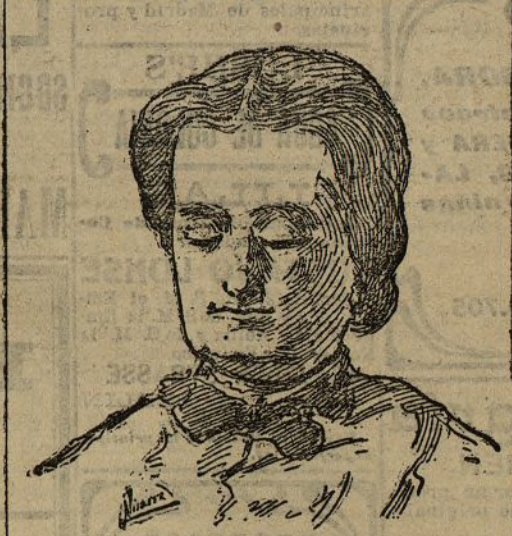
En la actualidad