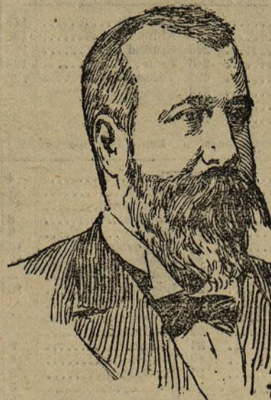
D. Marcelino Menéndez Pelayo Encargado de contestar al nuevo académico

Ha hecho los honores de la casa al recién llegado el Sr. Menéndez y Pelayo, quien empieza su discurso con un elogio del nuevo