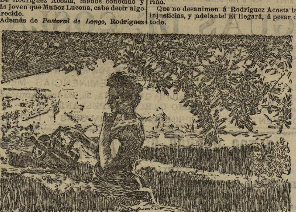
LA NIÑA DEL GENERALIFE, cuadro de Muñoz Luena

zando con dar muerte á éstos si no se le atiende en seguida.