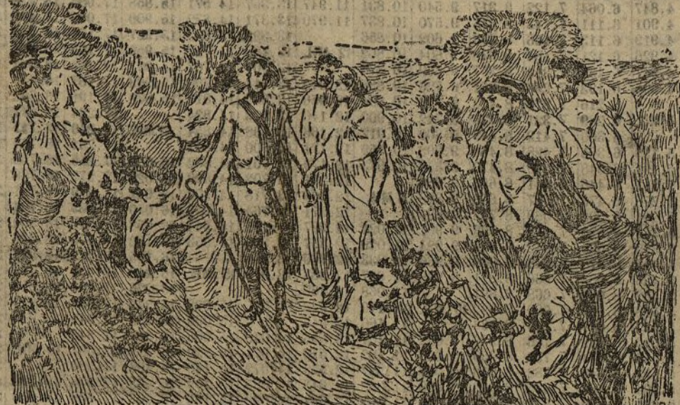
PASTORAL DE LONGO, cuadro de D. José Rodríguez Acosta

El cuadro de Muñoz Luena que hoy reproducimos, que con otros tres constituyen la obra del notable pintor cordobés en esta Exposición, es una nota de color brillante, atrayente y simpática, que nos muestra al artista en pleno vigor de producción; Muñoz Luena es de los que en este Certamen han tenido de parte del Jurado las atenciones que por su obra y su historia merecían. El público, sin embargo, que toma lo bueno sin recomendaciones de nadie, le ha hecho justicia; y ante La niña del Generalife , como ante el Marcado de flores en Granada , deteniéndose, admira y aplaude.