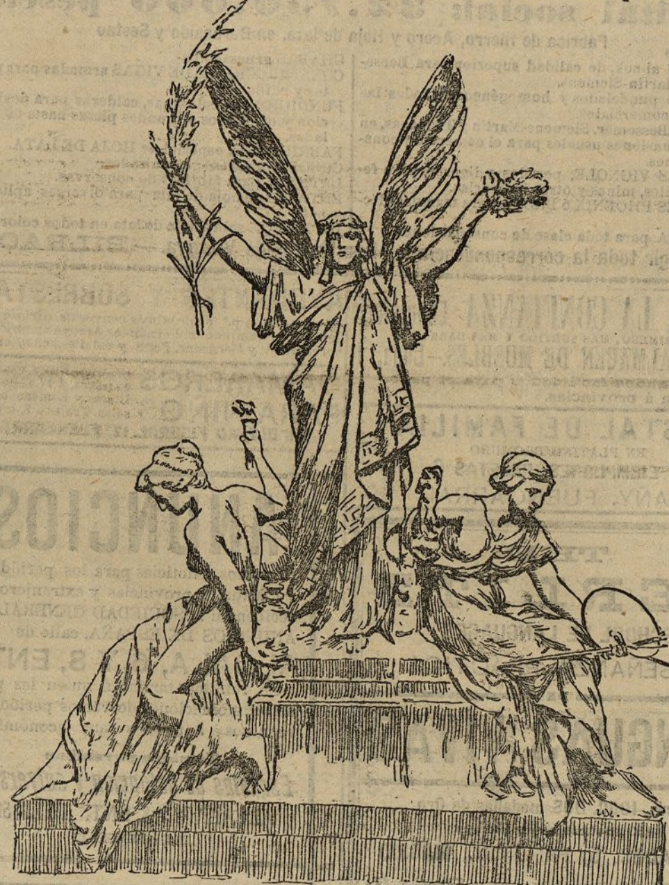
La Gloria coronando á las Ciencias y las Artes

Dentro de pocas semanas quedarán definitivamente colocados los grupos monumentales que coronan el nuevo edificio de los ministerios de Agricultura y Bellas Artes, ejecutados aquéllos por el insigne escultor D. Agustín Querol.