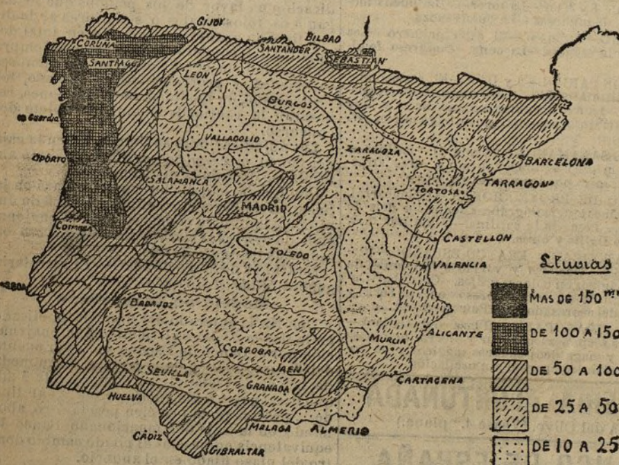
La lluvia en España.—Cantidad de lluvia en Febrero

He leído atentamente este libro de la Dirección general de Agricultura El regadío en España , he escuchado las conferencias del Ateneo y he considerado atentamente estos dos mapas publicados en los Anales del Bureau Central météorologique .