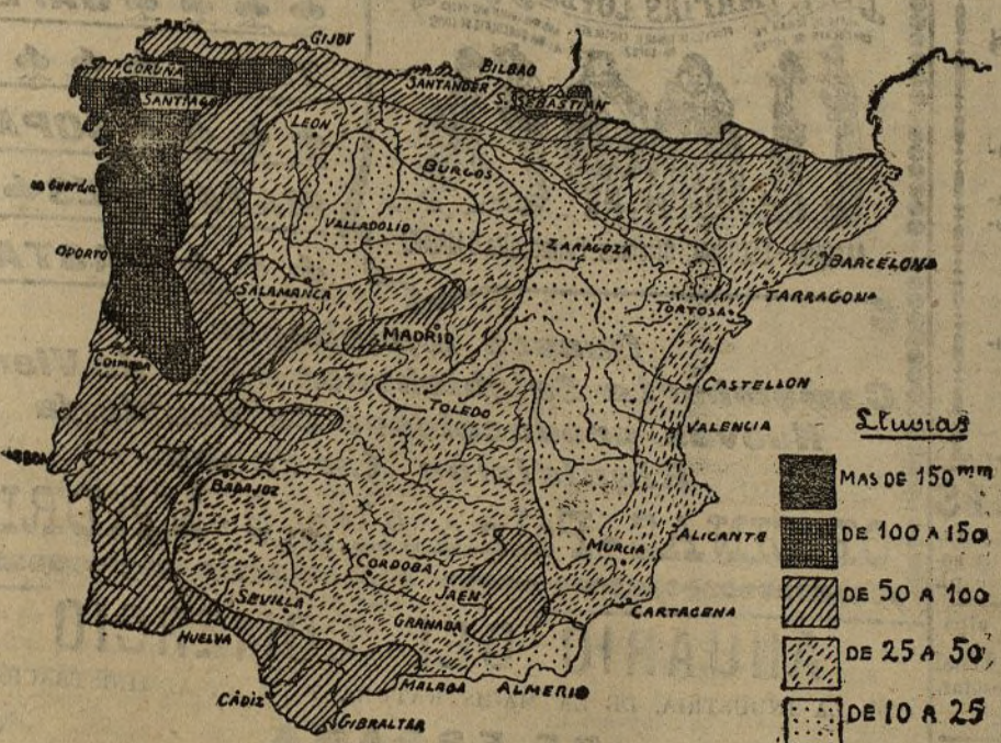
La lluvia en España.—Cantidad de lluvia en Febrero

He leído atentamente este libro de la Dirección general de Agricultura El riego en España , he escuchado las conferencias del Ateneo y he considerado atentamente estos dos mapas publicados en los Anales del Bureau Central meteorológico .