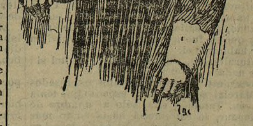
D. Mariano Gaspar y Remiro autor de la obra Muslimana , que ha obtenido el Premio Aledo

Y entre éstos debe clasificarse y está el doctor entusiasta de la Universidad de Ginebra, que es el Sr. Gaspar Remiro de los que se limitan á cumplir la fórmula externa del deber oficial; la cátedra sirve de acicate para posteriores trabajos, y en el silencio fecundo de su gabinete y de las bibliotecas, y en la consulta y cotejo de códices y manuscritos y en el discernimiento de todo lo que integra y reconstruye un pueblo, una época, un período ó un hecho, el notable orientalista busca y logra decir la última palabra en la materia.