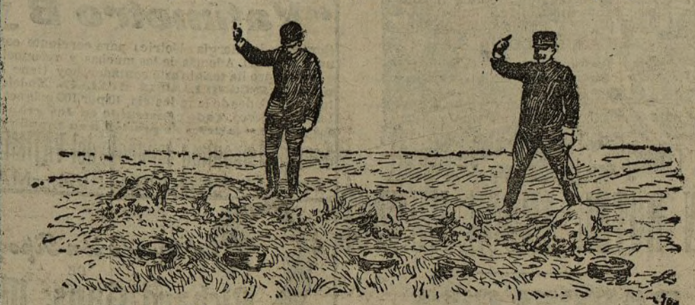
Perros italianos tomando el rancho a la voz de mando

Conocida es la inteligencia de tan simpáticos animalitos, y como el hombre, al domesticado, la mayoría de los animales no se ha conformado con los servicios que en tiempo de paz le prestan, sino que les impone su cooperación en la guerra, dadas las cualidades de estos fieles servidores, el servicio militar es obligatorio—y nunca mejor empleado al cacareado concepto—se imponía.