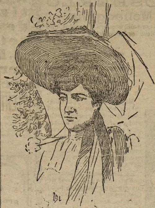
La princesa Mohammed Ibrahim