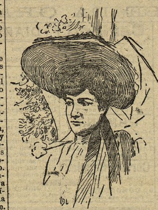
La princesa Mohammed Ibrahim

Así, es muy raro que una princesa egipcia con-