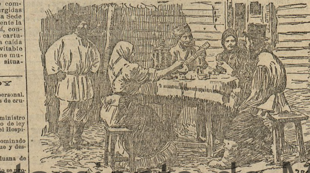
Tomando el té en la puerta de la isba

Esta es la verdadera bebida nacional, no faltando en ninguna casa, desde la isba más humilde a la mesa del emperador.