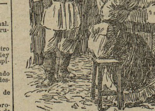
Tomando el té a la puerta de la isba

Esta es la verdadera bebida nacional, no faltando en ninguna casa, desde la isba más humilde a la mesa del emperador.