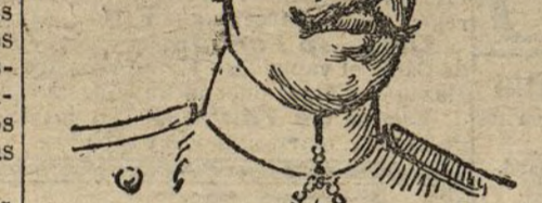
El jetife de Egipto.

Sus desahos de europeizarlos poniéndose en contacto con los soberanos y jefes de Estados europeos, y estudiar de visu la organización de estos pueblos, es, según dicen, lo que en su visita se propone el jetife, por más de que, dada la situación en que se halla por la ocupación militar del Egipto por los ingleses, el asesor de los Farones debe proponerse tan sólo un viaje de recreo.