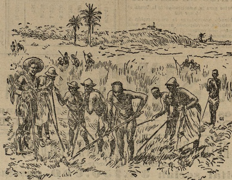
Sembrando el flame

Mas para que asunto tan complejo pueda ser llevado   cabo, se hace imprescindible la creaci n de un Estado Mayor Central en la forma propuesta por el Sr. Galarza, porque no basta que los ministros de la Guerra se asesoren de jefes de todas las armas y cuerpos; pues por muy distinguidos que sean los de que en este caso se ha asesorado el general Linares, seguramente no le ser n menos los que pudieran aconsejar   otro ministro, aunque tambi n es seguro que habr an de tener criterio diferente.