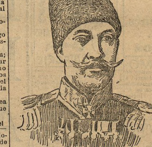
El general Stoessel

Además se han apoderado del fuerte número 1.