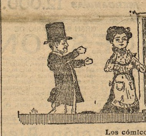
Los cómicos del Guignol

Allí no habrá lujo ni maldita la falta que hace; pero resplandece el asco en los palcos,