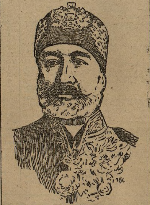
EL BEY DE TÚNEZ

Se encuentra en París desde antaño Sidi-Mohamed, bey de Túnez, al cual llaman sus compatriotas el Pacífico por los esfuerzos que desde su advenimiento al Poder viene haciendo para conciliar los intereses de todos cuantos viven en el Protectorado. Sidi-Mohamed tiene ahora cuarenta y siete años y hace dos que lleva las riendas del Gobierno; pero no en la forma que las llevaban sus antecesores, sino dedicándose con alma y vida á los negocios de Estado. Instalado en su hermosa residencia de Dornelch, situada al pie de la colina de Cartago, va dos veces por semana á la capital para dar audiencia y atender las reclamaciones de grandes y pequeños. Su deseo de europeizarse le ha llevado á París, de donde seguramente sacará provechosas enseñanzas. Ayer asistió, en compañía del presidente de la República, á la gran revista de Longchamps, celebrada con motivo de ser el 14 de Julio.