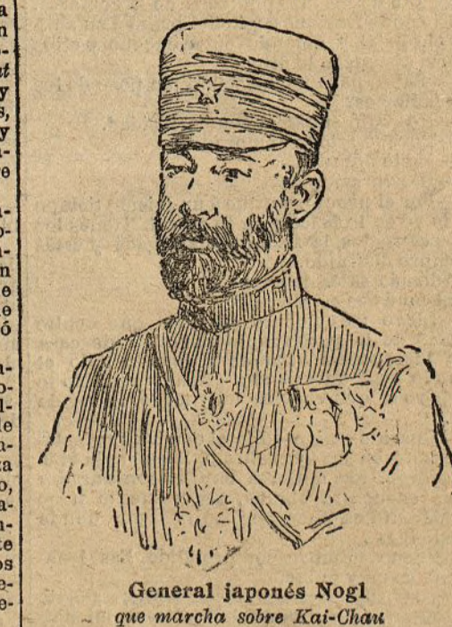
General japonés Nogai

El estado moral de las tropas es excelente