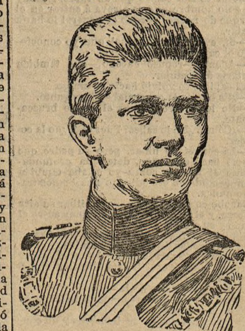
El príncipe Fernando María de Borbón, supuesto pretendiente a la mano de la infanta Doña María Teresa.

Los señores suscriptores de Madrid que trasladen su residencia a provincias durante los meses de verano, tendrán derecho a recibir nuestro periódico en el punto que designen, abonando por adelantado el importe de un trimestre de suscripción.