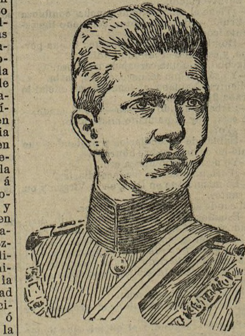
El príncipe Fernando María de Borbón, supuesto pretendiente a la mano de la infanta Doña María Teresa.

Los señores suscriptores de Madrid que trasladen su residencia a provincias durante los meses de verano, tendrán derecho a recibir nuestro periódico en el punto que designen, abonando por adelantado el importe de un trimestre de suscripción.