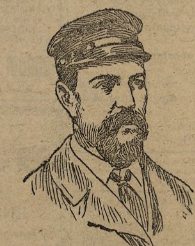
El capitán Sycamore