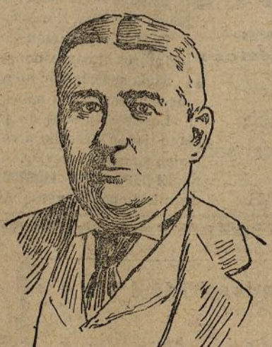
El capitán Plant