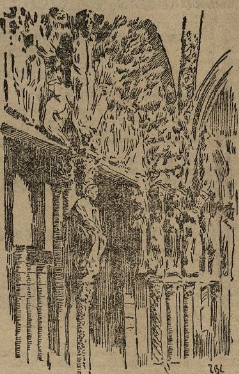
Entrada á la catedral de Santiago, llamada «Portal de la Gloria»

que hay obras de salubridad preferentes á esa, y porque no respondemos á un plan de conjunto en la urbanización de la ciudad.