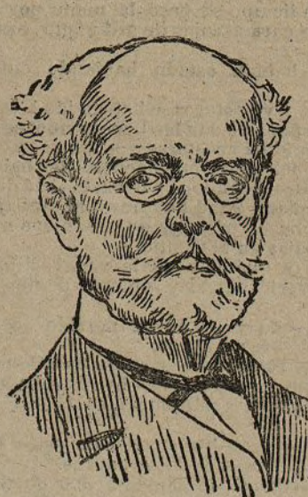
El maestro Pedrell