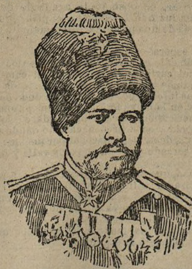
El general Lioubavine

— Londres 28. El Daily Mail dice que en Suaz circula el rumor de que en el mar Rojo han aparecido barcos de guerra japoneses.