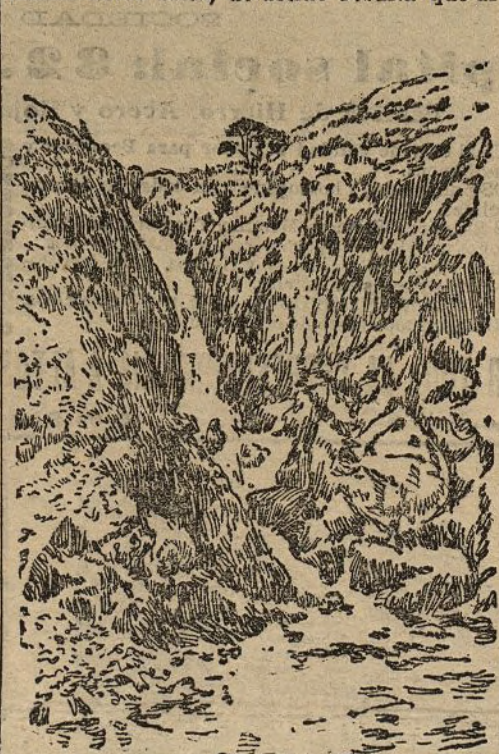
Cascada del Pino

Además, las limosnas que se recogen entre los banistas pudientes se reparten equitativamente entre ellos, de donde resulta que al