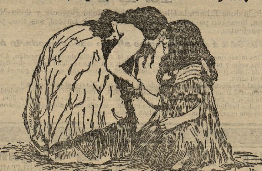
Las mujeres maoris saludándose

En Nueva Zelanda, en esas islas de la Polinesia, situadas en el Pacífico Austral, está el país de los maoris, que ofrece para nosotros curiosas particularidades.