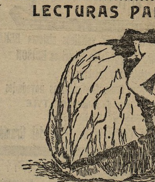
Dos mujeres maoris saludándose

En Nueva Zelanda, en esas islas de la Polinesia, situadas en el Pacífico Austral, está el país de las maoris, que ofrece para nosotros curiosas particularidades.