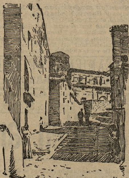
Una calle del pueblo

En medio de aquella extensión vastísima, Gallur ocupa la más privilegiada situación.