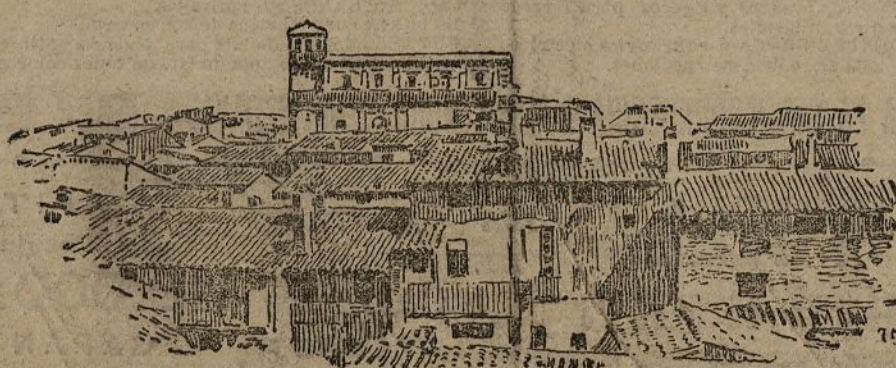
Vista general de Gallur

Por su situación topográfica, Gallur es uno de los pueblos más afortunados de Aragón. Recostadas sus tertorias viviendas en la falda de un áspero monte, domina al pueblo la feraz llanura como celoso guardador de los ricos tesoros de sus campos.