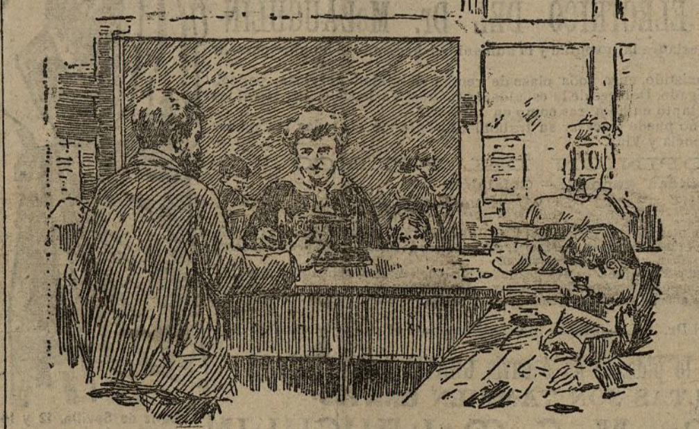
Empeñando la máquina de coser

MAÑANA EL COSO BLANCO EN GIJÓN por DIONISIO PÉREZ